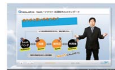
1分でわかる商品紹介