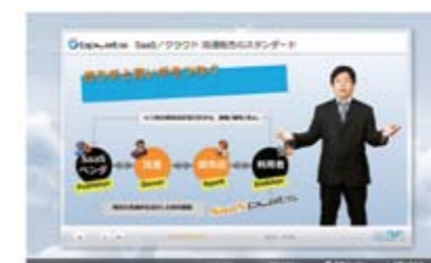
1分でわかる商品紹介